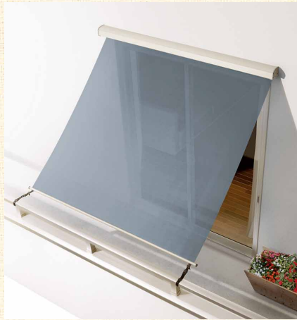
▲2階のバルコニーに